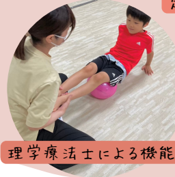
理学療法士による機能訓練