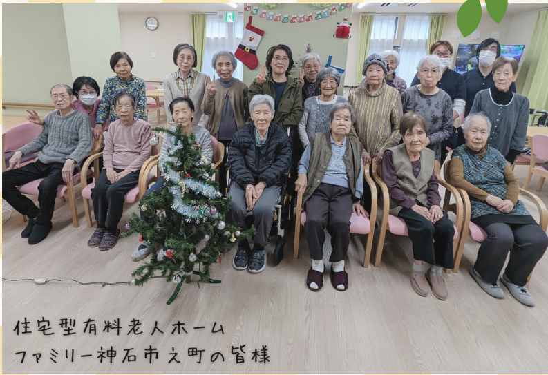
住宅型有料老人ホーム ファミリー神石市文町の皆様

新年ご挨拶 『我々は コミュニティやサービスを通じて 地域の方々のもう一人の家族を目指します』 という経営理念のもと地域の皆様が笑顔になるように居場所と役割、 そして安心のご提供をしております。 医療、介護、福祉という枠に捉われず、様々なお困りごとを親身になっ て寄り添い、お手伝いをさせていただきます。 弊社は、全員が禁煙者で、お客様、スタッフさんの健康もとても大切に しています。 SDGs、健康経営、多様性も尊重し、在宅ワークや出産、育児、介護休 暇など、それぞれの人生のステージに合わせた柔軟な働き方も可能で、 SCS(泉州ケアサービス)は、これからも地域の皆様が笑顔になるように 安心をお届けして参ります。