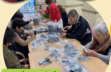
シルバーワークで 日々の生活にやりがいと 居場所の提供^^