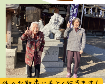
外へお散歩にもよく行きます!