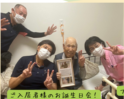
ご入居者様のお誕生日会! なんと98歳!お元気です(^.^)