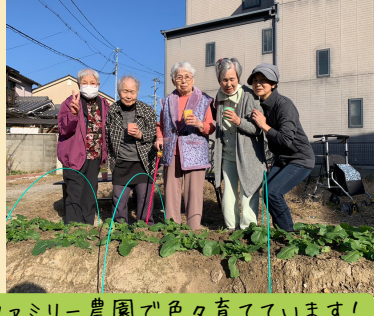
ファミリー農園で色々育てています!