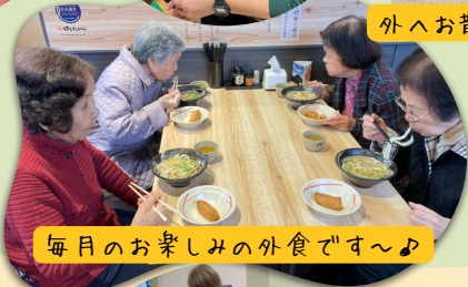
毎月のお楽しみの外食です～♪