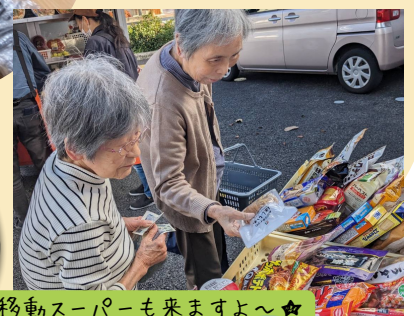
移動スーパーも来ますよ～☆