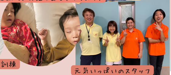
元気いっぱいスタッフ