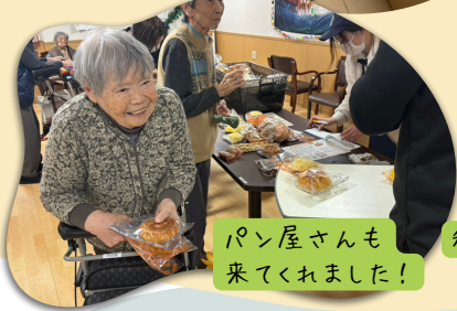
パン屋さんも 来てくれました!