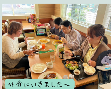
外食にいきました～