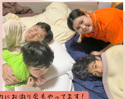
定期的にお泊り会もやってます!