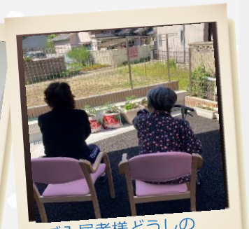
ご入居者様どうしの だんらんの場をパチリ♪