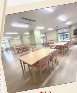
明るく広い 共有スペース！