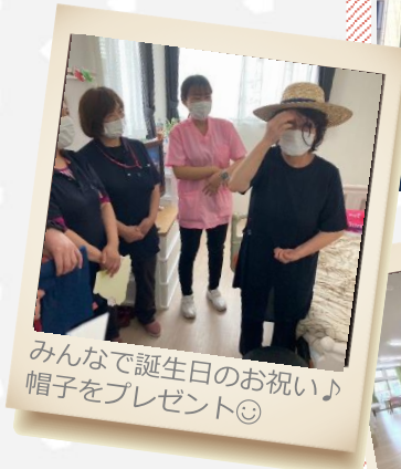
みんなで誕生日のお祝い♪ 帽子をプレゼント😊