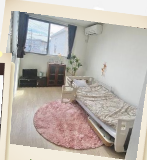
お部屋の一例です