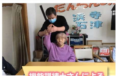
機能訓練士さんによる 機能訓練